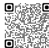
Bản đồ dự báo nguy hiểm