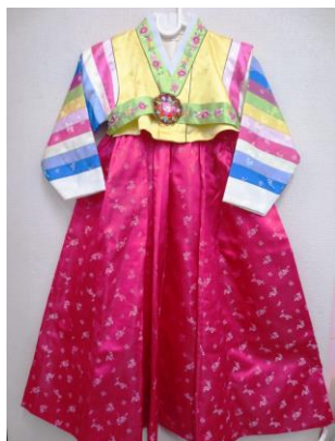
《韓国女性の民族衣装・チマチョゴリ(こども用)》

韓国の伝統的なめんこ「タクジ」を、みんなで作りました。牛乳パックや新聞で作ることができます。