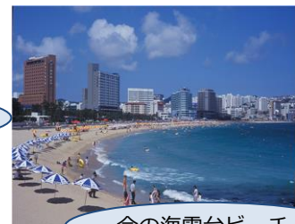
今の海雲台ビーチ