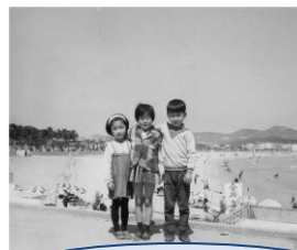
昔の海雲台ビーチ