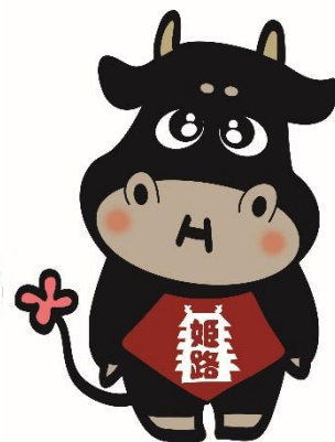
姫路和牛PRキャラクター