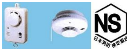
Loại treo tường Loại treo trần nhà Kí hiệu NS

Có những loại như: treo tường, treo trần nhà với giá khoảng 3000 yên là có thể mua được. Hãy mua loại có kí hiệu NS (sản phẩm đạt tiêu chuẩn kiểm định của Hiệp hội kiểm định phòng cháy chữa cháy Nhật Bản).