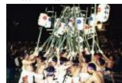
Lễ hội Đèn lồng

Ngoài ra, trong thành phố Himeji, các lễ hội mùa thu được tổ chức trọng tâm ở các đền tại các khu phố. Xin hãy tham gia vào các lễ hội để tận hưởng niềm vui cùng với truyền thống.