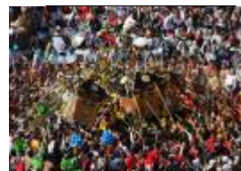
Fiesta de lucha en Nada

Acceso: A pie al este desde la estación de Mizoguchi de la línea Bantan de JR. (10 min.)