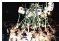
Fiesta de farolillos

La fiesta de KOIMO (patata pequeña) Su nombre tiene su origen porque la imagen de la carroza del desfile en Bamba (hipódromo antigua) mirada hacia abajo desde el Haiden (capilla sintoísta), se parece como cuando lavan las patatas pequeñas en un mortero. Se celebra un desfile de carrozas en Bamba y en Haiden, luego suben la cuesta empinada hasta la cima. Por la tarde, bajan la cuesta "Cuesta de Iroha" y finalmente se hace un desfile en Bamba y se acaba dando tres vivas.