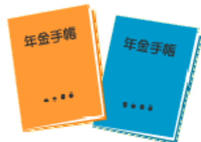
画像-ゆうちょくらぶ http://www.yucho-club.jp/secondlife/01/c-1-10.html

-Oficina del seguro social de Himeji tel :079-224-6361