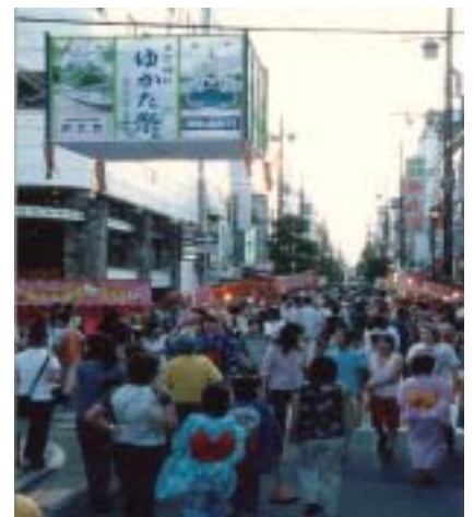
姫路ゆかたまつり

姫路観光協会 ホームページ http://www.himeji-kanko.jp/